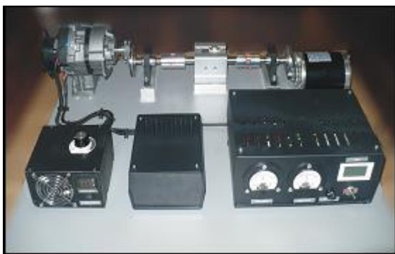
Rys. 2. Widok ogólny stanowiska do badania elektromechanicznego zespołu napędowego.

Stanowisko przeznaczone jest do celów dydaktycznych i pozwala przeprowadzić badania elektromechanicznego zespołu napędowego (rys. 2), ze szczególnym wyeksponowaniem pomiaru momentu skręcającego na wale napędowym.