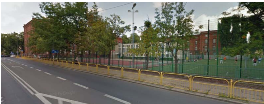
Rys. 2. Dokumentacja fotograficzna szkoły Gimnazjum nr 32 z zespołem Szkół Ogólnokształcących nr 2 w Szczecinie.

Kolejne tematy będą związane z tym zagadnieniem i będą poruszać inne aspekty urbanistyczne. Jednym z podstawowych opracowań dotyczących kompozycji dla studentów architektury jest publikacja K. Wejcherta [13]. Literatura ta pozwala na przykładzie różnych miast zrozumieć istotę kształtowania wnętrza urbanistycznego. Posłużono się wytycznymi zaczepnymi z niej do oceny wnętrza urbanistycznego.