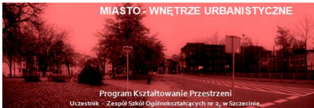
Rys. 1. Plansza tytułowa prezentacji dla Zespołu Szkół Ogólnokształcących nr 2 – Gimnazjum nr 32 w Szczecinie, w ramach uczestniczenia w programie Kształtowania Przestrzeni [12]. Na zdjęciu widoczne Gimnazjum, szkoła uczestników prezentacji.

Przedstawiono temat: Miasto - wnętrze urbanistyczne (rys. 1). Wybór tematu powstał jako pomysł na zagadnienie wstępne do dalszych rozważań o tematyce urbanistycznej. Dla celów analizy wybrano miejsce: ul. Plac Dziecka i Kopernika, w kierunku do ul. Wojska Polskiego i ul. Bogusława w Szczecinie. Gimnazjum nr 32 z zespołem Szkół Ogólnokształcących znajduje się właśnie przy ul. Kopernika (rys. 2). Wzięto pod uwagę, że przestrzeń ta dla młodzieży będzie dobrze znana, skoro codziennie w niej przebywa.