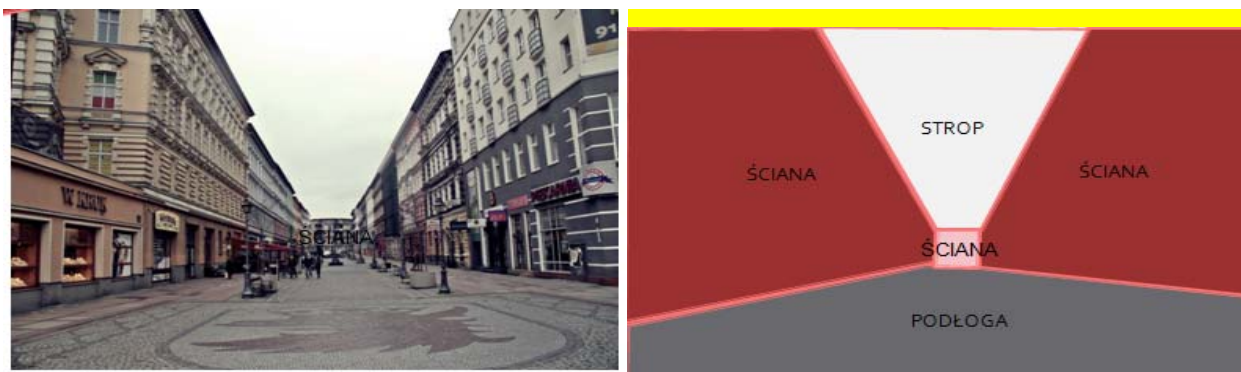
Rys. 6. Analiza elementów wnętrza urbanistycznego na wybranym przykładzie przestrzeni miejskiej ul. Bogusława Szczecin [12].

Na podstawie wybranych przestrzeni miasta przedstawiono poszukiwanie elementów tworzących to wnętrze. Następnie młodzież samodzielnie wykonała przedmiotowe analizy. Oznaczenie tych elementów na fragmentach przestrzeni miejskiej pozwoliło na lepsze zrozumienie zagadnienia (rys. 7). Wybrane przestrzenie miejskie dotyczą przestrzeni sąsiednich wokół szkoły