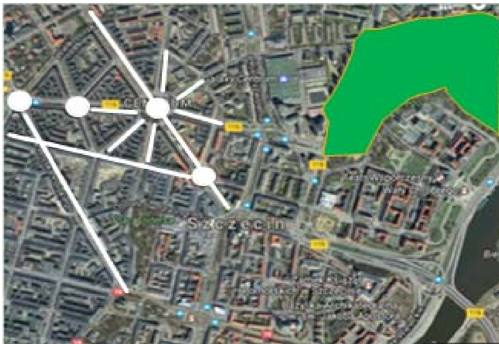
Rys 3. Miasto - forma urbanistyczna [4, 12].

Zdaniem L. Kriera [8] trudno jest sobie wyobrazić budynek całkowicie wyizolowany od rzeczywistości. Nie ma budynków bez podłoża, czyli sieci dróg i placów (rys. 4). Stąd celowo w prezentacji wykorzystano zamysł pokazania oderwanych budynków (res publica), oraz place i ulice (res ecconomica), wraz z wersją całości – czyli prawdziwego miasta (civitas). Autorka zgadza się ze słowami L. Kriera, że niezależnie od swoich rozmiarów budynki oddziałują na otaczający je świat. Co ważniejsze, przesłanka do tworzenia przestrzeni urbanistycznej powinna uwzględniać fakt, że powinny one powstawać jako część większej całości. L. Krier wyraźnie wskazuje, że budynki nigdy nie są neutralne - zawsze wywierają jakiś wpływ, pozytywny lub negatywny. Ma to istotne znaczenie, gdyż zdaniem L. Kriera budynki są aktywne.