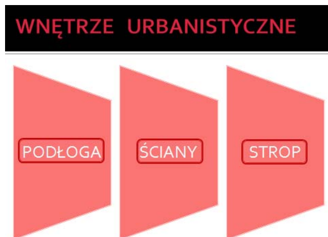
Rys. 5. Schemat przedstawienia uczestnikom prezentacji elementów wnętrza urbanistycznego [12].