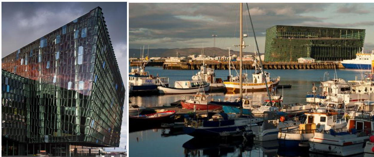
Rys. 2. Harpa. Sala Koncertowa i Centrum Konferencyjne Reykjavik - Reykjavik, Islandia - finalista konkursu o Europejską Nagrodę Mies van der Rohe 2013 [7].

Elewacja Sali koncertowej składa się ze szklanych parciei, przezroczystych i barwionych, opartych na stalowym szkielecie. Inspiracją do tego tematu dla projektantów były kryształy znajdujące się skałach bazaltu. Czyż te kryształy nie są piękne? powrócę do tego zagadnienia dalej, gdyż w poszukiwaniu zrozumienia tego piękna poświęcę fragment urokowi tych skał w dalszej części. W założeniu projektowym Harpa efekty kolorystyczne podkreśla gra światła odbijającego się od powierzchni wody w zatoce Taxa. Tak więc jest to współczesny przykład piękna, wizji projektanta, która została wydobyta i zauważona przez odbiorcę. A sama inspiracja została zaczerpnięta z natury. Bo zawsze aktualne pozostaje twierdzenie że natura jest piękna.