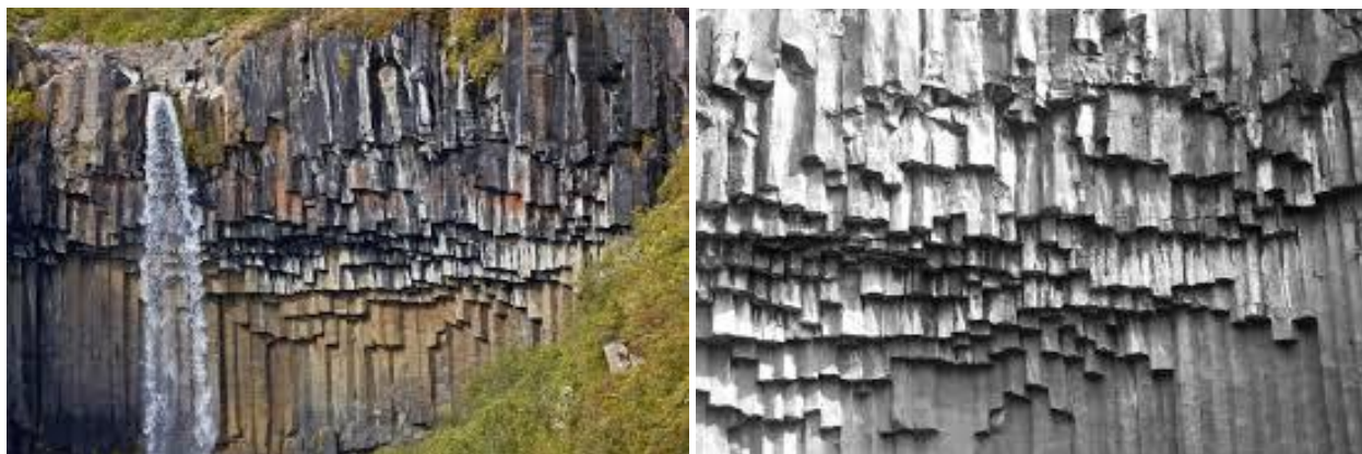
Rys. 4. Wodospad Svartifoss w Parku Skaftafell w Islandii. Odkrywanie naturalnego piękna skał.

Piękno wodospadu Svartifoss w Parku Skaftafell w Islandii, gdzie formacje bazaltowe nadają kompozycje trójwymiarową – to naturalne piękno skał, które było inspiracją do dzieła architektonicznego (rys. 4). Obecnie zespół Harpa stał się jednym z najważniejszych symboli miasta. Czyli uznać można, że to piękno zostało zauważone i docenione.